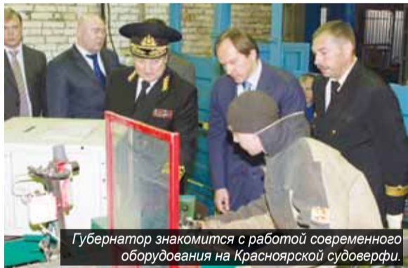
Губернатор знакомится с работой современного оборудования на Красноярской судовой верфи.