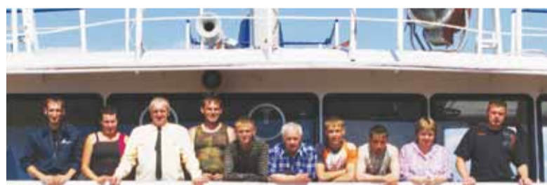
IMO 8925300 Экипаж теплохода «Солнечногоorsk».

Но, в отличие от других судов, нынешняя навигация для «Солнечногоорска» особенная: с выходом из затона весной началась, по сути, его вторая рабочая жизнь на Енисее. Дело в том, что долгое время – с 1997 по 2009 год – теплоход работал в составе флота мореплавания Енисейского пароходства на Чёрном, Средиземном и других южных морях дальнего от нас региона. В 2009 году начался процесс возвращения на Енисей морских судов. В тот год