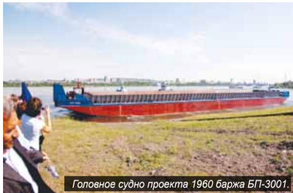
Главное судно проекта 1960 баржа БП-3001.