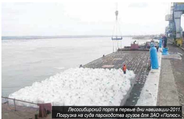
Лесосибирский порт в первые дни навигации-2011. Погрузка на суда пароходства грузов для ЗАО «Полюс».