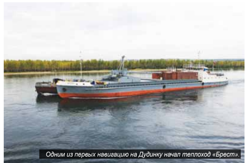
Одним из первых навигацию на Дудинку начал теплоход «Брест».

Навигация в Лесосибирском порту в этом году, как и всюду по Енисею, началась рано: уже 19 апреля порт отправил первые суда за лесом, а 22 апреля приступил к перевалочным работам по отправке грузов на северные притоки Енисея.