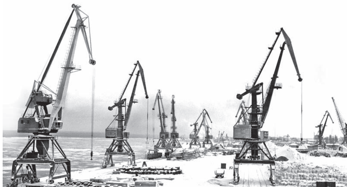
Причалы Лесосибирского порта под снежным покрывалом.

краны из эксплуатации для планового ремонта. На судах тоже скоро начнётся ремонт.