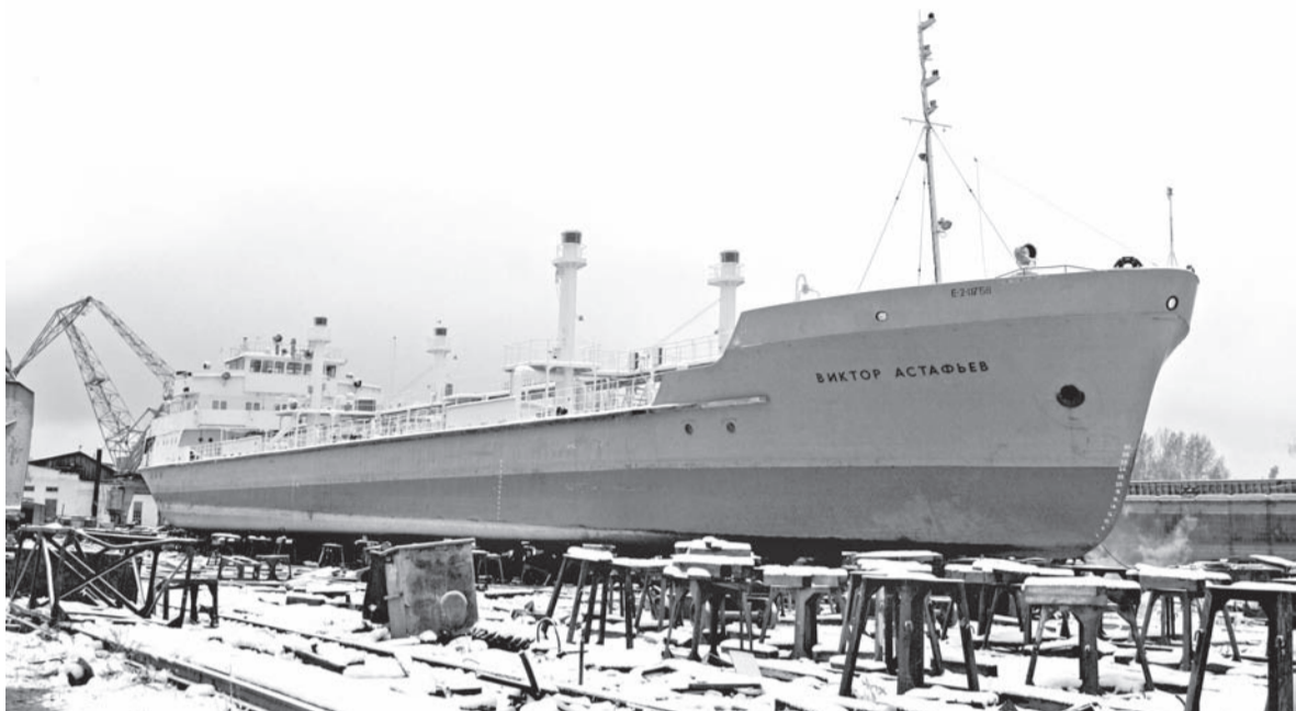
Танкер «Виктор Астафьев» на слипе Подтёсовской РЭБ флота.

Ремонтные бригады Красноярского судоремонтного центра заняты,