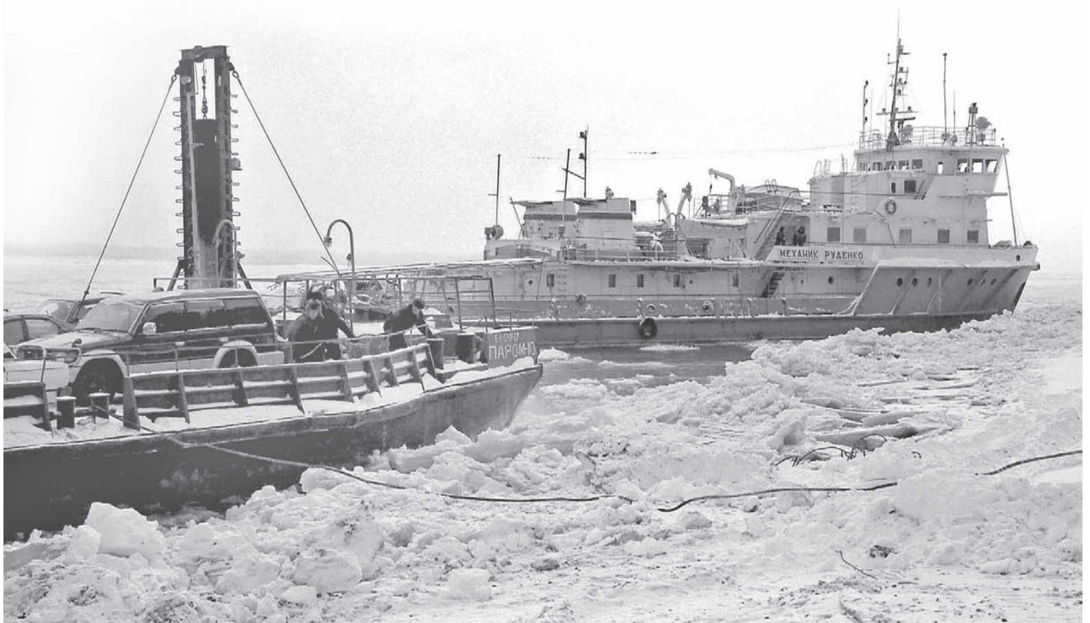
«Механик Руденко» привёл подтёсовский паром к берегу.

11 декабря к работе подтёсовской паромной переправы вновь присоединился теплоход «Механик Руденко». «БТ-303» и «Садко» уже с трудом буксировали «Паром-10» от Подтёсова до Комаров и обратно. После недельного потепления, из-за которого кромка льда слегка спустилась и перестала подниматься, внезапно ударил сильный мороз. Всё чаще стали появляться ледовые поля, у берега намерзало много шуги. Это существенно осложнило движение состава. Теплоходу «Механик Руденко» не привыкать работать в таких условиях, поэтому