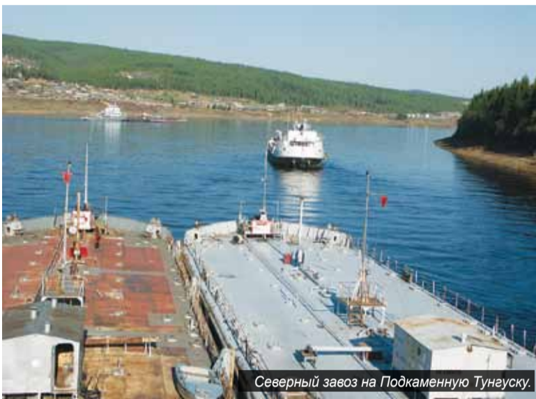
Северный завоз на Подкаменную Тунгуску.