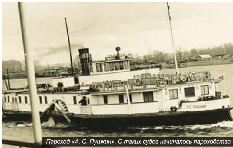
Пароход «А. С. Пушкин». С таких судов начиналось пароходство.

» Министр РФ по делам гражданской обороны, чрезвычайным ситуациям и ликвидации последствий стихийных бедствий, Герой РФ, генерал армии Сергей Шойгу: