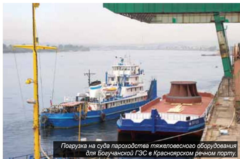
Погрузка на суда пароходства тяжеловесного оборудования для Богучанской ГЭС в Красноярском речном порту.

– Енисейское речное пароходство (Окончание на стр. 4).