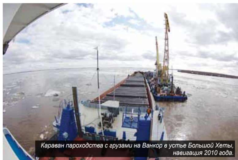
Караван пароходства с грузами на Ванкор в устье Большой Хеты, навигация 2010 года.

Хотелось бы сказать слова благодарности за ваш труд, за те транспортные услуги, которые вы оказываете. Так держать!