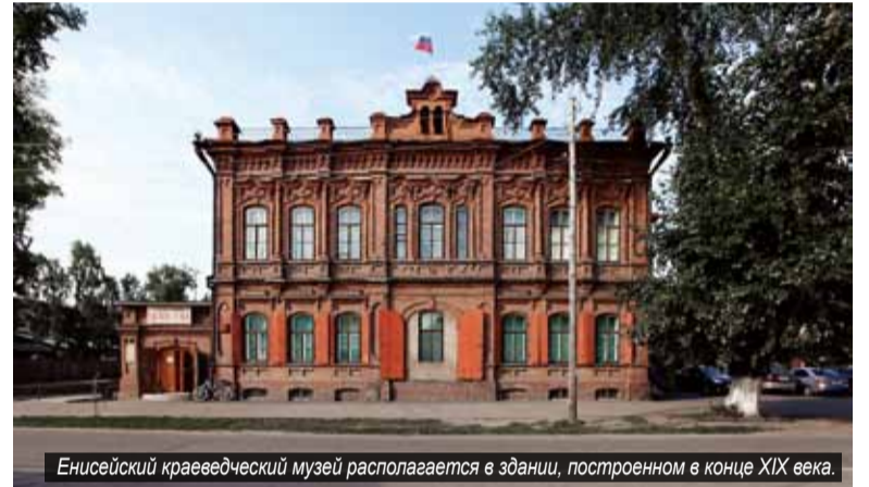
Енисейский краеведческий музей располагается в здании, построенном в конце XIX века.

– В нынешнем году экспозицию «Освоение Северного морского пути» мы дополнили соответствующими материалами из запасников и посвятили её 100-летию пребывания в Енисейске норвежского путешественника и исследователя Фритьофа Нансена, – рассказывает директор Муници-