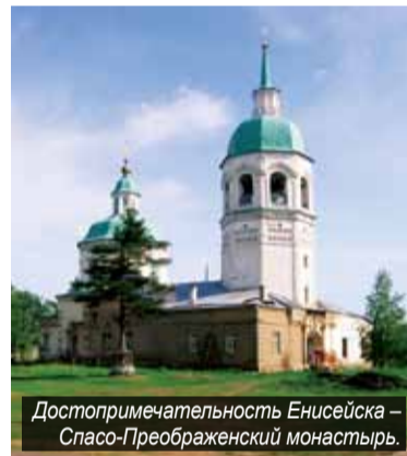
Достопримечательность Енисейска – Спасо-Преображенский монастырь.

Для жителей и гостей организуется площадка «Енисейск православный» с церковными лавками и выставкой