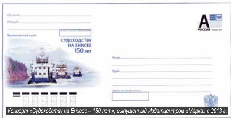
Конверт «Судоходству на Енисее – 150 лет», выпущенный Издательством «Марка» в 2013 г.

с коллекциями филателистов, принять участие в беспроигрышной лотерее, приобрести в розницу самые популярные газеты и журналы, интересные