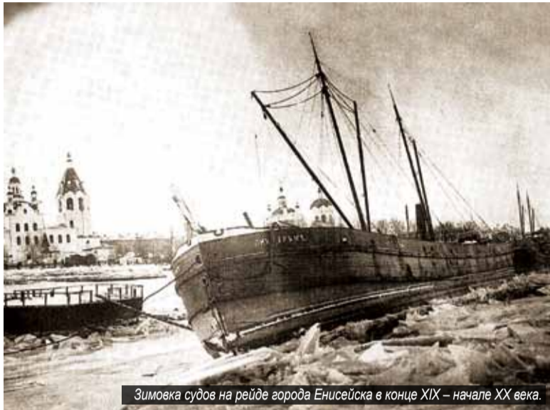
Зимовка судов на рейде города Енисейска в конце XIX – начале XX века.

Флот на Енисее пополнялся также за счёт перегонов Северным морским путём. В 1897 году на Енисей прибыли пароходы «Иоанн Кронштадтский», «Гленмор» и «Скотия». В составе этой экспедиции был адмирал С. О. Макаров, который встретился с енисейскими купцами и оговаривал с ними возможность торговли через Северный морской путь на Нижнем Енисее с использованием стыковочных рейсов морских и речных судов. Он убеждал купцов