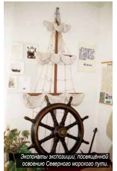
Экспонаты экспозиции, посвящённой освоению Северного морского пути.

Сергей ИВАНОВ