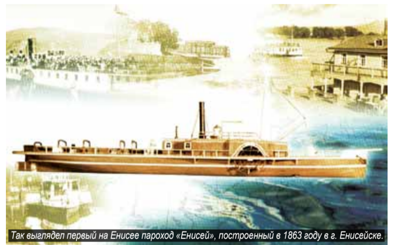
Так выглядел первый на Енисее пароход «Енисей», построенный в 1863 году в г. Енисейске.

Всевозможные развлечения, от игрушек до интерактивных игр, приготовлены для юных енисейцев на детских площадках «Август шаловливый». На праздновании «Августовского Нового года» пройдёт детское костюмированное шествие, состоится