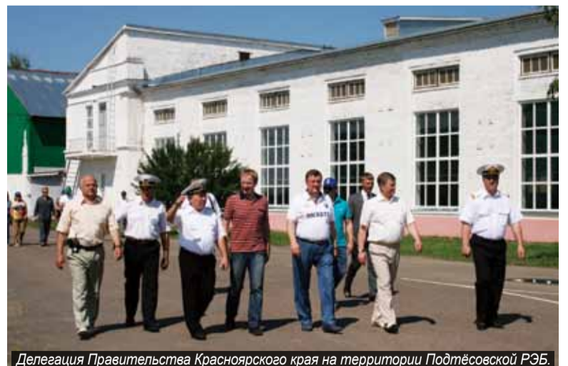
Делегация Правительства Красноярского края на территории Подтёсовской РЭБ.

В свою очередь, руководство ОАО «Енисейское речное пароходство» и Подтёсовской РЭБ флота обратило внимание председателя краевого Правительства на проблемы, которые волнуют речников – жителей посёлка Подтёсово. Это, прежде всего,