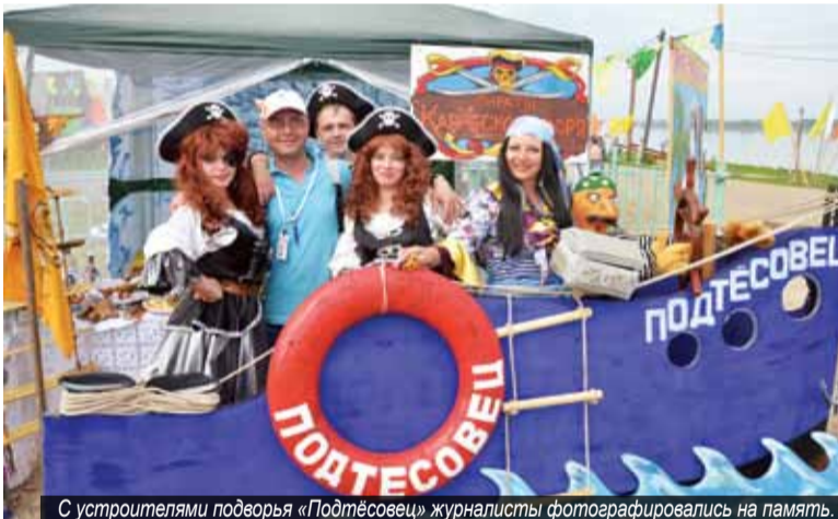
С организаторами подворья «Подтёсовец» журналисты фотографировались на память.

Второй день, 15 июня, журналисты посвятили участию в рейде с рыбнадзором по выявлению браконьер-