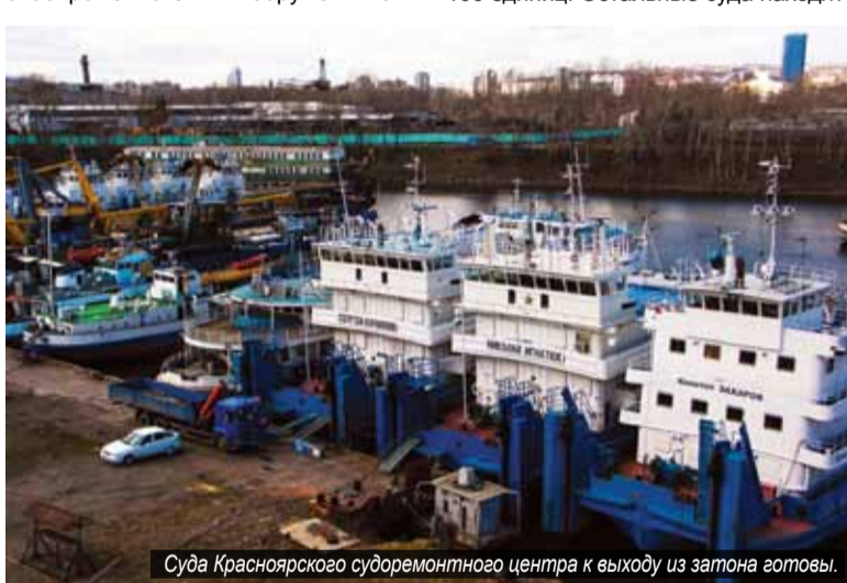
Суда Красноярского судоремонтного центра к выходу из затона готовы.

В этом году погода – ранняя, чем прогнозировалось, оттепель – внесла свои коррективы, и вооружение было объявлено несколько раньше, чем было запланировано. Но распоряжение об этом из управления ОАО «Енисейское речное пароходство» коллектив цеха технической эксплуатации, как говорится, не застало врасплох. По первому требованию, своевременно были вооружены теп-