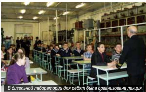
В дизельной лаборатории для ребят была организована лекция.

Затем школьники распределились по группам, для каждой из которых была устроена экскурсия по