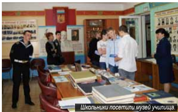
Школьники посетили музей училища.