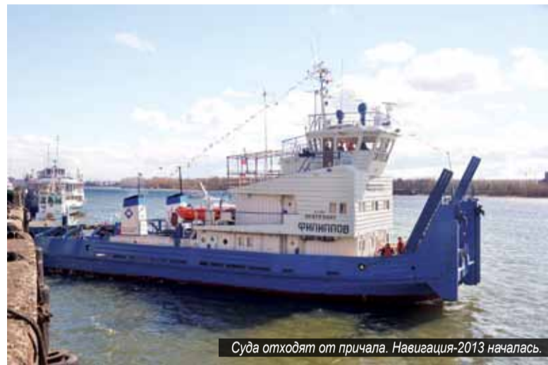
Суда отходят от причала. Навигация-2013 началась.