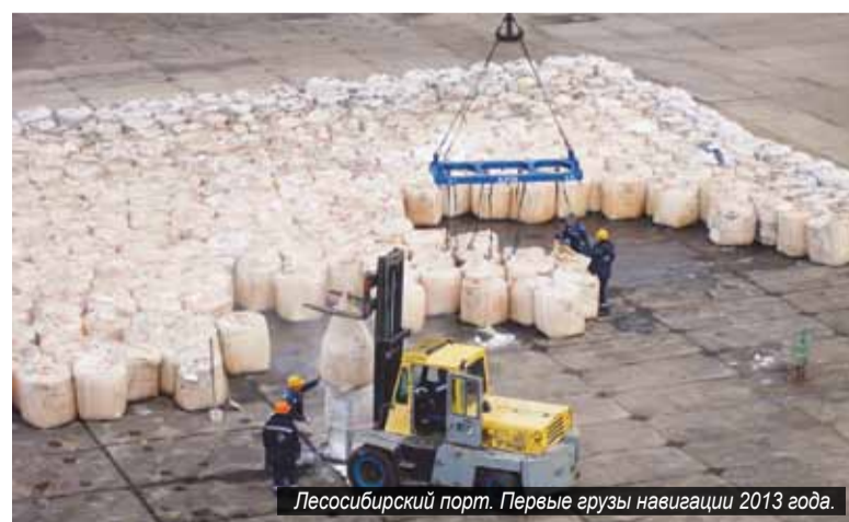
Лесосибирский порт. Первые грузы навигации 2013 года.

— В том, что касается подготовки к предстоящей навигации, всё идёт по плану. Со снабжением, закупками, по ремонтным работам каких-то вопросов особой сложности нет, — отметил