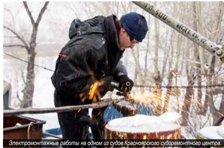
Электромонтажные работы на одном из судов Красноярского судоремонтного центра.

– Как уже говорилось ранее, объём финансирования судоремонта несколько снизился относительно прошлогоднего уровня, поэтому пришлось ограничиться в желаниях. Новые двигатели ставятся на пяти судах – только на тех, ресурс которых продлить невозможно. Двигатели, которые также необходимо менять, но ресурс которых имеем право продлить самостоятельно сроком на один год, при условии предъявления дефектации и согласования, мы ремонтируем и ресурс их продляем. Замена таких двигателей