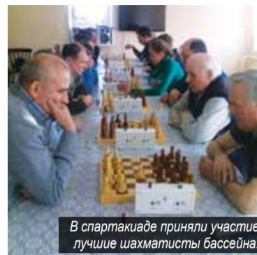
В спартакиаде приняли участие лучшие шахматисты бассейна.