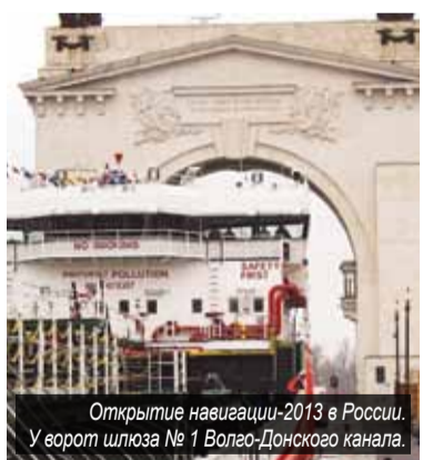
Открытие навигации-2013 в России. У ворот шлюза № 1 Волго-Донского канала.