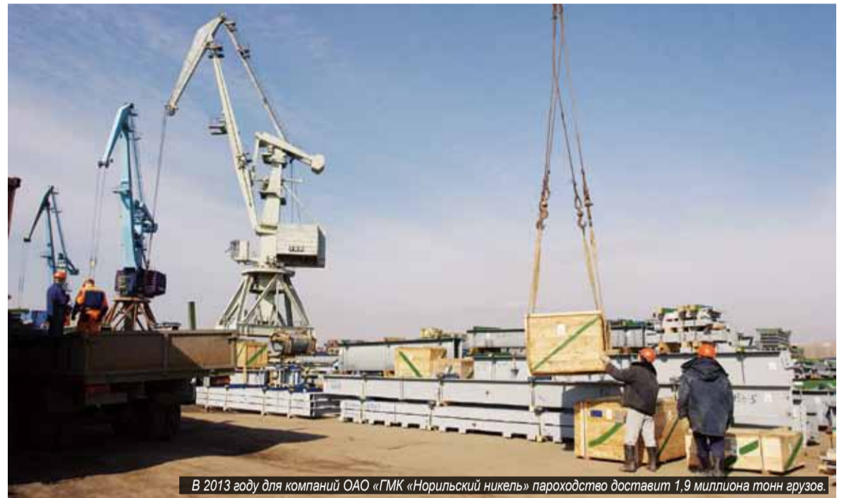
В 2013 году для компаний ОАО «ГМК «Норильский никель» пароходство доставит 1,9 миллиона тонн грузов.

Что касается северного завоза, государственные тендеры для нужд жителей отдалённых районов края ещё идут, и пароходство принимает в них активное участие. Пока определены объёмы доставки нефти по заявке МП ЭМР «Эвенкиянефтепродукт». 10 тысяч тонн нефти ЕРП перевезёт с базы Славянка Куомбинского месторождения на реке Подкаменная Тунгуска на Нижнюю Тунгуску, до посёлка Тура. По предварительным данным, для жителей отдалённых районов Севера и Заполярья пароходство планирует