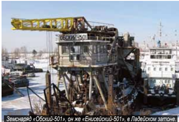
Земснаряд «Обский-501», он же «Енисейский-501», в Ладейском затоне.

Кроме того, дноуглубительный флот Красноярского района «Енисей-