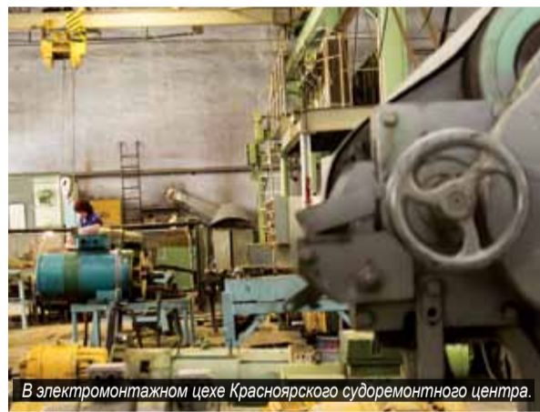
В электромонтажном цехе Красноярского судоремонтного центра.