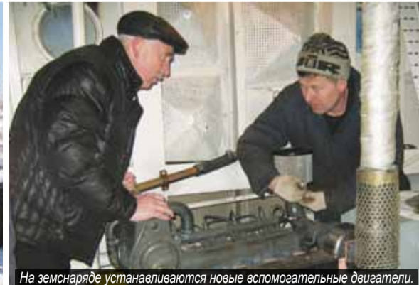
На земснаряде устанавливаются новые вспомогательные двигатели.