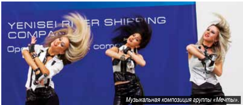
Музыкальная композиция группы «Мечты».

благодарили их за большую, важную работу, которую сотрудницы управления выполняют всегда ответственно, добросовестно, и пожелали им домашнего тепла и уюта, добра, здоровья, прекрасного настроения.