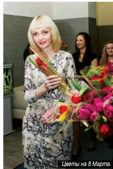
Цветы на 8 Марта.