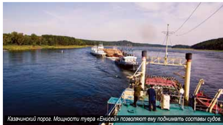
Казачинский порог. Мощности туера «Енисей» позволяют ему поднимать составы судов.