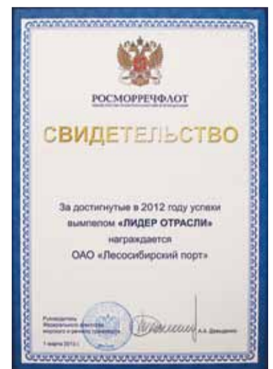
Свидетельство о награждении Лесосибирского порта вымпелом «Лидер отрасли».