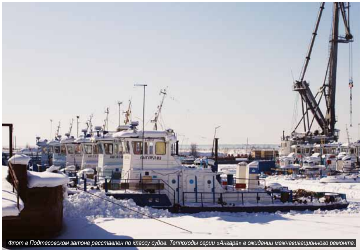
Флот в Подтёсовском затоне расставлен по классу судов. Теплоходы серии «Ангара» в ожидании межнавигационного ремонта.

Морозы ещё не в полной мере властны над водами Енисея. Если в первых числах декабря затон уже был покрыт более-менее устойчивым льдом, то на самой реке ещё продолжала действовать паромная переправа сообщением от устья Подтёсовского затона до урочища Комары. Ледовая кромка на Енисее была в ста километрах выше – в районе устья реки Кии. Но уже 5 декабря лёд дошёл до устья затона, и паромную переправу пришлось закрыть. 6 декабря стали на разоружение теплоходы «Механик Данилин», «РТ-694», «Подтёсовец» и «Ледоход», которые были задействованы в обеспечении паромного сообщения. Навигация-2012 в