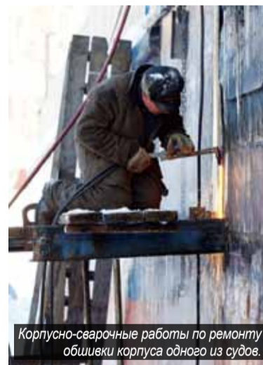
Корпусно-сварочные работы по ремонту обшивки корпуса одного из судов.

По мере промерзания затона будут разворачиваться работы на всех судах, подлежащих ремонту. Там, где возможно, будет делаться выморозка, с тем чтобы оголить движительно-рулевые комплексы и корпуса судов, тогда можно будет всё это посмотреть, продефектовать, где надо