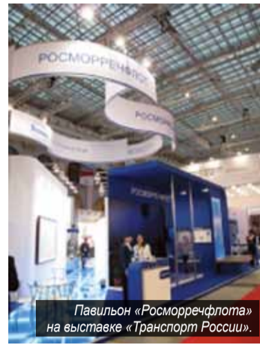
Павильон «Росморречфлота» на выставке «Транспорт России».