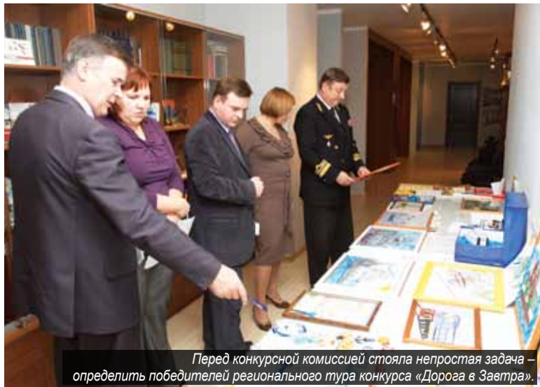
Перед конкурсной комиссией стояла непростая задача – определить победителей регионального тура конкурса «Дорога в Завтра».