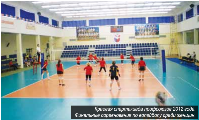
Краевая спартакиада профсоюзов 2012 года. Финальные соревнования по волейболу среди женщин.

В постановлении Федерации профсоюзов дана хорошая оценка речникам в деле организации и участия в соревнованиях спартакиады. Из 13 краевых комитетов отраслевых профсоюзов, соревнующихся во второй группе участников, Енисейский баскомфлот занял четвертое место (в спартакиаде 2011 года речники были на третьем месте). Наибольший вклад в копилку сборной команды речного флота внесли спортсмены из трудовых коллективов Красноярского судоремонтного центра, Красноярского института водного транспорта, Енисейского района водных путей и судоходства, управления ОАО «Енисейское речное пароходство». Федерацией профсоюзов Красноярского края разработано и утверждено Положение о краевой спартакиаде 2013 года. В программу спартакиады включено десять видов спорта. Первыми вступают в борьбу лыжники. Соревнования по лыжам запланировано провести в третьей