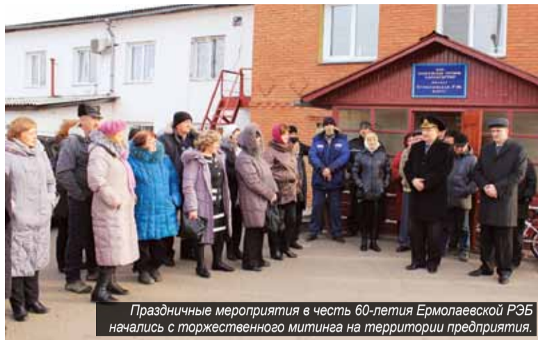
Праздничные мероприятия в честь 60-летия Ермолаевской РЭБ начались с торжественного митинга на территории предприятия.

Речников за их добросовестный труд поблагодарил также председатель бассейнового комитета Профсоюз