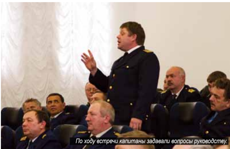
По ходу встречи капитаны задавали вопросы руководству.