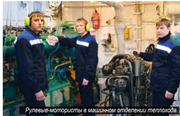
Рулевые-мотористы в машинном отделении теплохода.