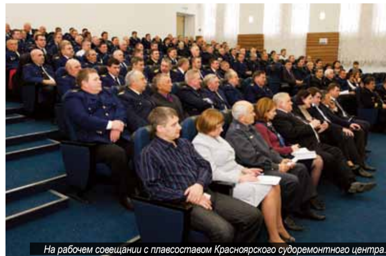
На рабочем совещании с плавсоставом Красноярского судоремонтного центра.

Форс-мажорные обстоятельства не привели к срывам перевозок предъявленных грузов – все они были доставлены в пункты назначения, не вылились в аварии и катастрофы – судоводители сработали безопасно. И эта работа была оценена достойно. Наиболее отличившимся в навигацию работникам плавсостава были вручены Благодарности Министра транс-