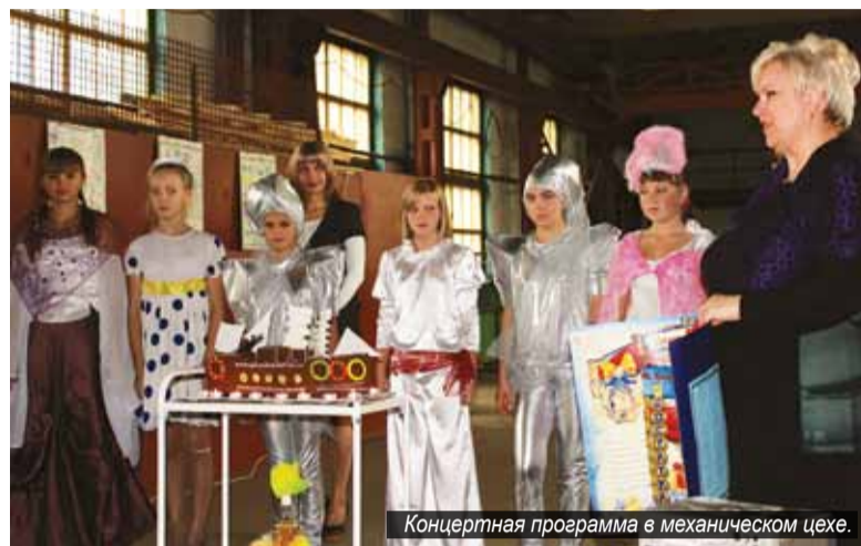
Концертная программа в механическом цехе.

В Ермолаевской РЭБ флота и посёлке речников Ермолаевский Затон прошли торжества в честь юбилея предприятия. 60 лет назад, в ноябре 1952 года, в Ермолаевской курье вынужденно зазимовали теплоход «Канск», восемь сухогрузных барж и лихтер. Так началась история становления и развития ремонтно-эксплуатационной базы флота.