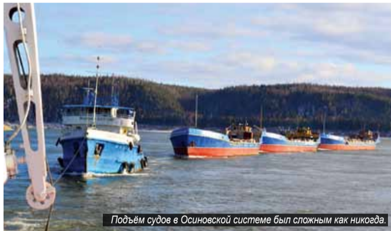
Подъём судов в Осиновской системе был сложным как никогда.

тиметров – достаточная для того, чтобы пройти «ОТ-2000». Миновав опасные участки, оставили баржу у острова Амбетова и спустились вниз, где стоял теплоход «Механик Данилин».