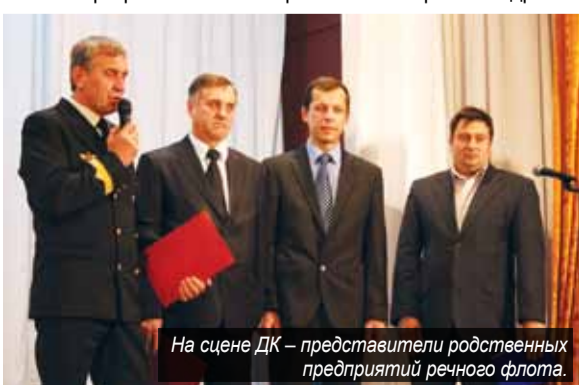
На сцене ДК – представители родственных предприятий речного флота.