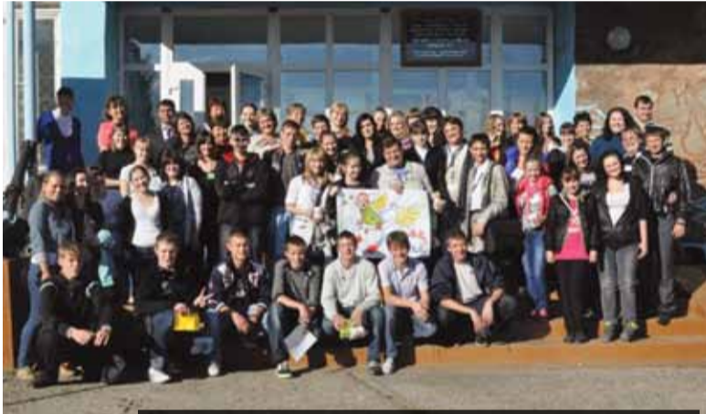
Участники первого Слёта инициативной молодёжи Енисейского района.