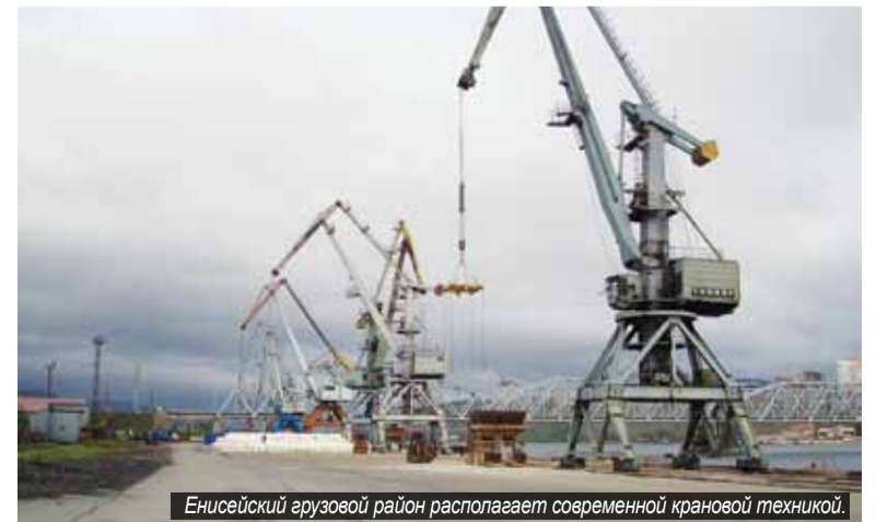
Енисейский грузовой район располагает современной крановой техникой.