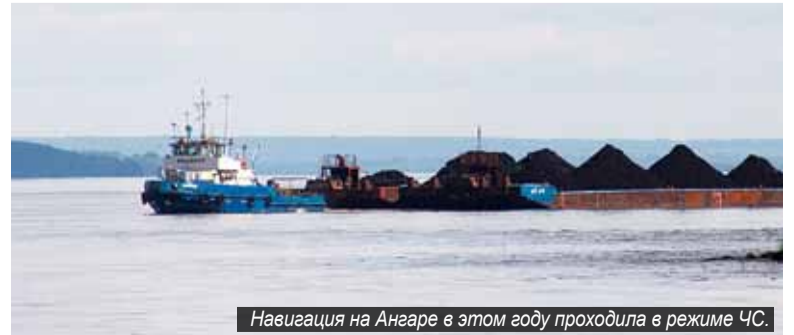
Навигация на Ангаре в этом году проходила в режиме ЧС.