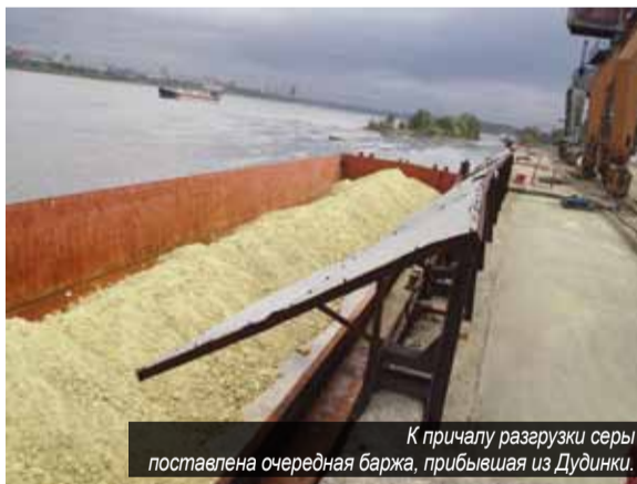
К причалу разгрузки серы поставлена очередная баржа, прибывшая из Дудинки.