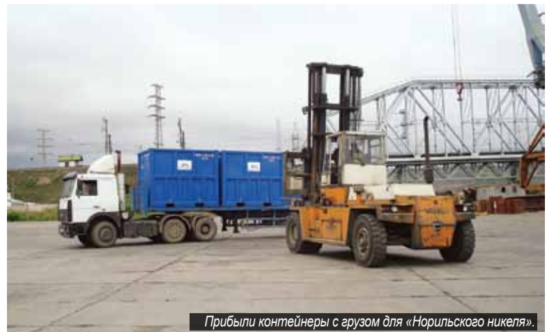
Прибыли контейнеры с грузом для «Норильского никеля».