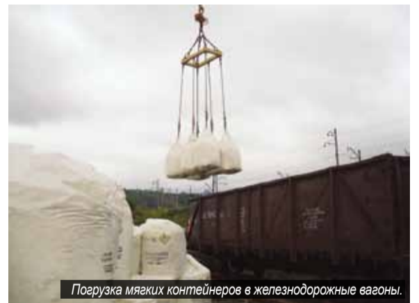
Погрузка мягких контейнеров в железнодорожные вагоны.

весь комплекс погрузочно-разгрузочных работ. И так каждую смену. Справляемся. Специалисты у нас широкого профиля: почти каждый докер-механизатор – и крановщик, и водитель автопогрузчика. В основном, все люди проработали в порту и по 10, и по 15 лет, а некоторые и