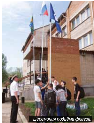
Церемония подъёма флагов.

2-3 июня в посёлке речников Подтёсово Енисейского района прошёл юбилейный X Краевой турнир по греко-римской борьбе на призы генерального директора ОАО «Енисейское речное пароходство» и главы Енисейского района.