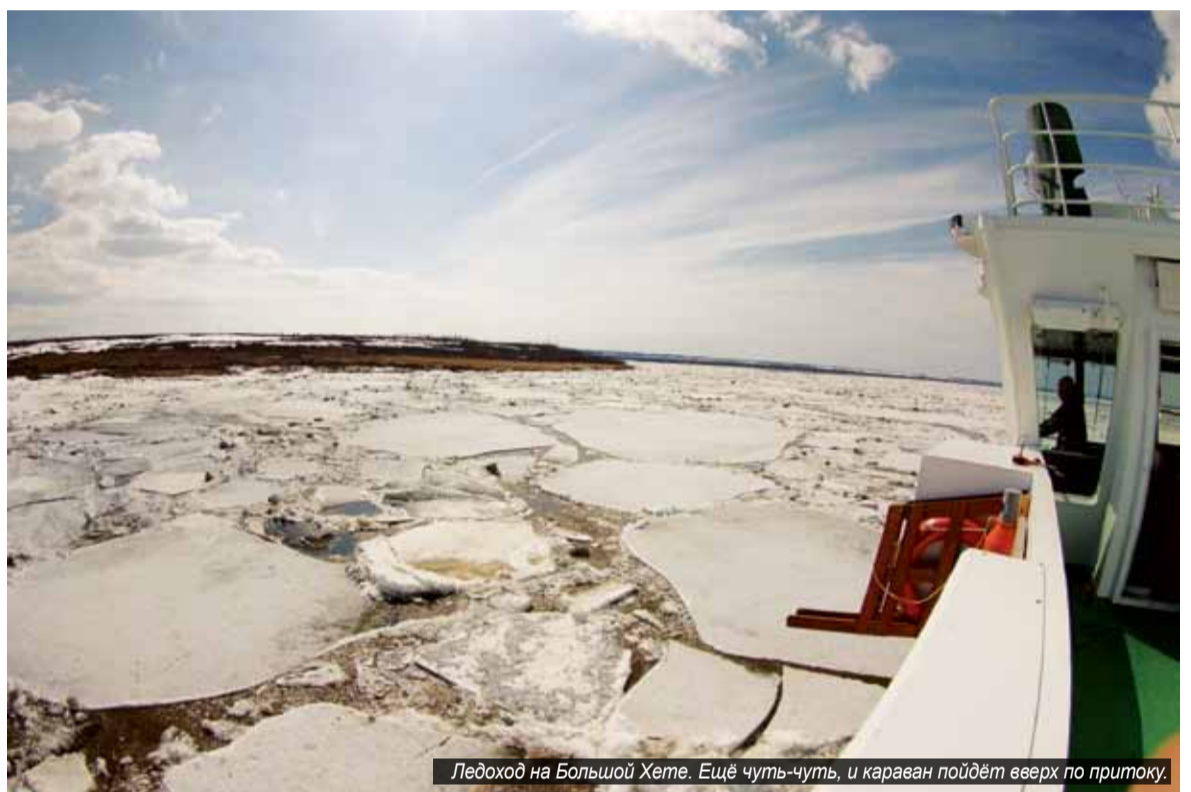
Ледоход на Большой Хете. Ещё чуть-чуть, и караван пойдёт вверх по притоку.

В первой декаде мая гружёные баржи из Красноярска начали транспортировать до Лесосибирска. Затем вместе с караванами для Эвенкии они были спущены до Подкаменной Тунгуски. Следую-