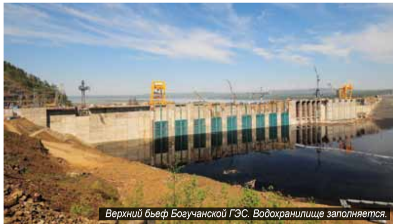
Верхний бьеф Богучанской ГЭС. Водохранилище заполняется.

Опасение Енисейского пароходства и других судоходных компаний вызвало весеннее понижение уровней воды в Ангаре по причине заполнения водохранилища строящейся Богучанской ГЭС. В плотине станции было перекрыто последнее временное донное отверстие, и с 9 мая водоток Ангары был переведён на стационарное водопропускное сооружение – водосброс № 1.