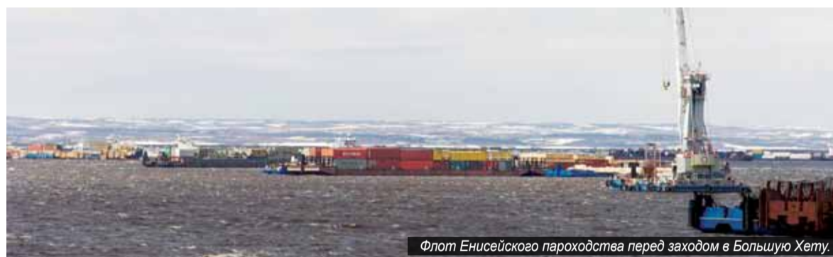
Флот Енисейского пароходства перед заходом в Большую Хету.

щий опорный пункт был в Туруханске, затем в Игарке. Так, вслед за уходящим льдом шли, догоняя друг друга, ванкорские караваны, вплоть до Дудинки, а от туда, уже более массивные и сплочённые, направлялись к Большой Хете.