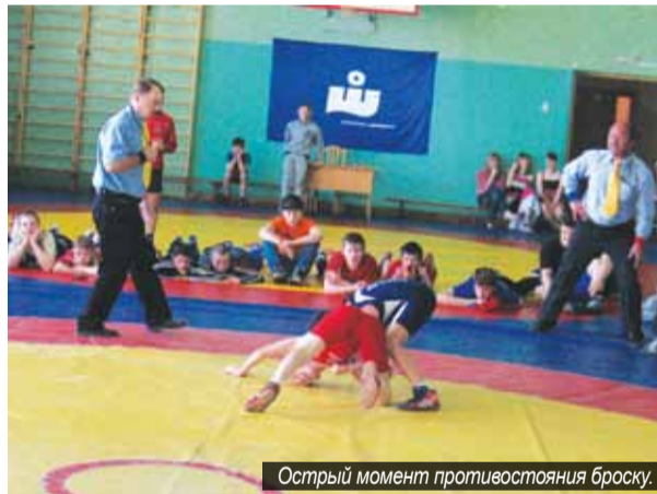
Острый момент противостояния броску.