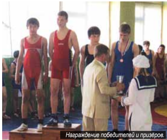
Награждение победителей и призёров.