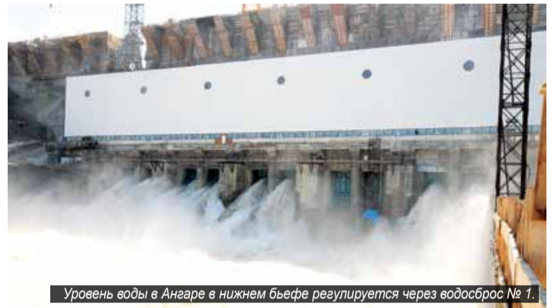
Уровень воды в Ангаре в нижнем бьефе регулируется через водосброс № 1.

» 9 июня на Ангаре, в нижнем бьефе Богучанской ГЭС, открылась паромная переправа, которую осуществляют суда Енисейского пароходства – теплоход «Светлогорск» и паром «Дивногорец».