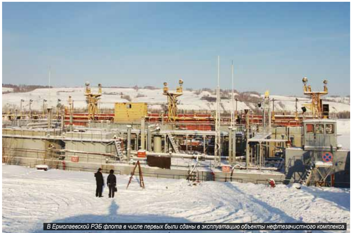
В Ермолаевской РЭБ флота в числе первых были сданы в эксплуатацию объекты нефtezачистного комплекса.

– Всего до начала навигации на притоках и большой навигации на магистральной линии по всем филиалам пароходства, согласно плану, необходимо сдать в эксплуатацию 470 судов, – рассказывает начальник отдела