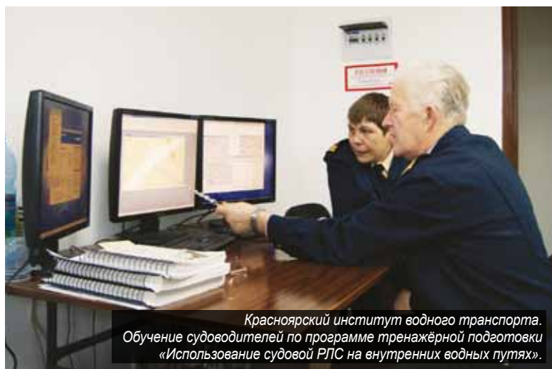
Красноярский институт водного транспорта. Обучение судоводителей по программе тренажёрной подготовки «Использование судовых РЛС на внутренних водных путях».

– По каким программам ведётся подготовка кадров плавсостава в этом году?