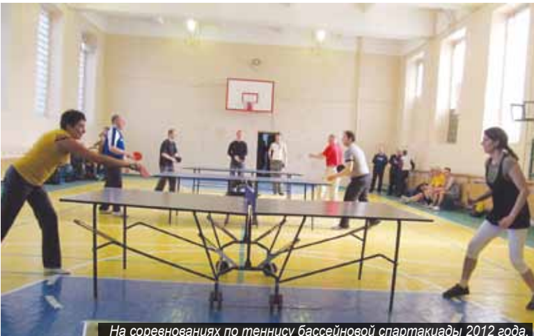
На соревнованиях по теннису бассейновой спартакиады 2012 года.