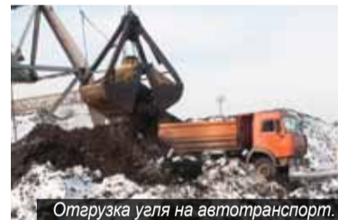
Отгрузка угля на автотранспорт.