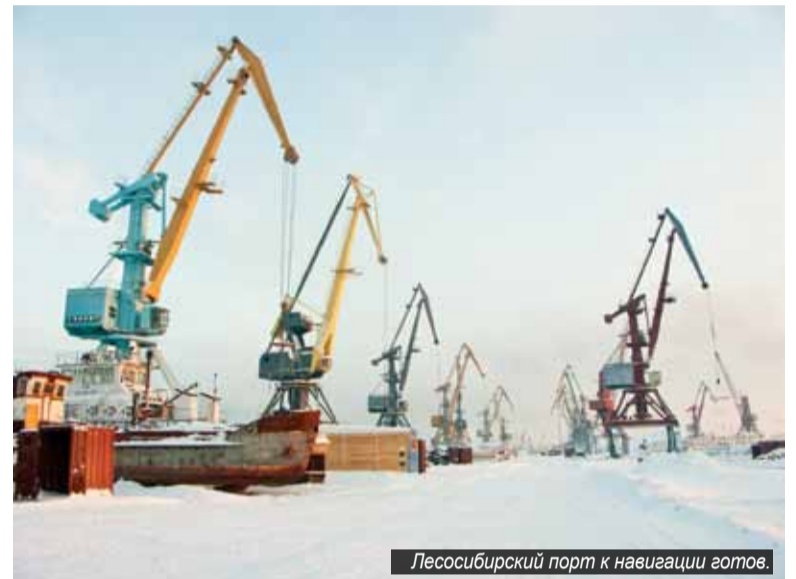
Лесосибирский порт к навигации готов.