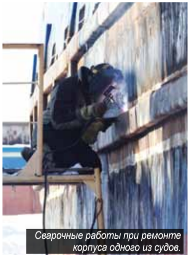
Сварочные работы при ремонте корпуса одного из судов.

вигацию 2011 года теплоходы «Пушкино», «Весьегонск», «Дмитров», «Северодонецк», «Солнечногорск», «Электросталь» работали на линиях Красноярск — Дудинка и Игарка — Байкаловск. Сегодня все экипажи без гордости демонстрируют объёмы продланного ремонта как снаружи корпуса, так и внутри. С помощью знаменитой подтё-