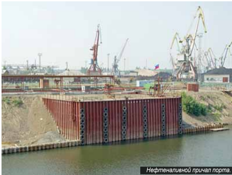
Нефтеналивной причал порта.