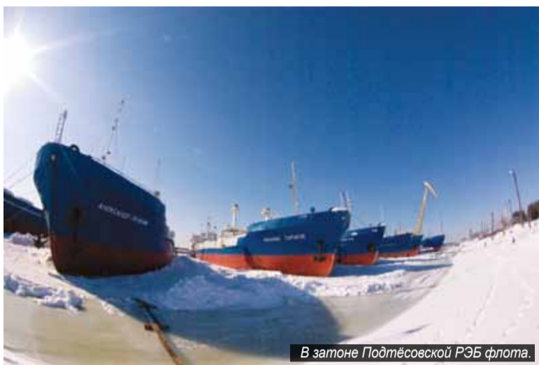
В затоне Подтёсовской РЭБ флота.

Кроме упомянутых «Ангар», на Подтёсовском слипе этой зимой ремонтируются: «Ангара-71» и «Ангара-61», «РТ-701» и «РТ-709», теплоходы «Академик Анучин», «Портовый-7», «Плотовод-622» и «Теплотехнический-5». На «РТ-701» и «РТ-709» производятся работы для их переклассификации из разряда «Р» в разряд «О». На остальных судах на слипе ведутся работы по замене обшивки, ремонту механизмов и ДРК, замене вспомогательных двигателей и прочее. Все они будут спущены на воду весной.