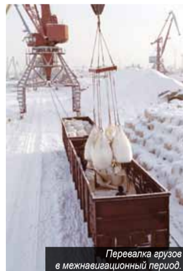
Перевалка грузов в межнавигационный период.

Лесосибирский порт – одно из лучших предприятий города Лесосибирска. На хорошем счету оно и у речников Енисея. Разумное соотношение цены и качества, исполнение заказов в срок снижали ему в крае добрую славу надёжного делового партнёра. Яркие свидетельства об этом итоги прошлогодней навигации, получившие на совещании высокую оценку генерального директора Енисейского пароходства.