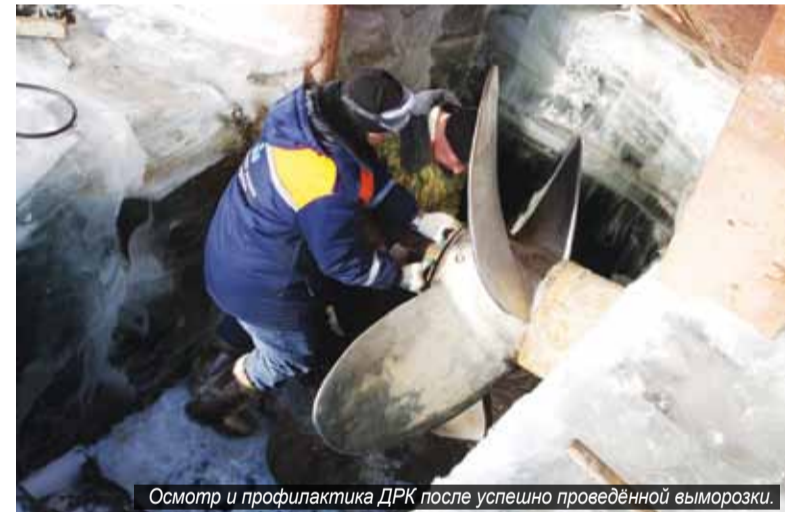
Осмотр и профилактика ДРК после успешно проведённой выморозки.