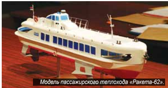
Модель пассажирского теплохода «Ракета-62».