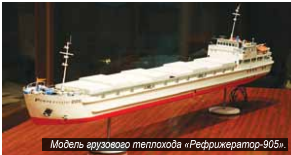
Модель грузового теплохода «Рефрижератор-905».

моделями судов как нельзя кстати. Дело в том, что после ремонта помещений музея создаётся его принципиально новая, современная экспозиция, над которой трудятся не только сотрудники и ветераны Енисейского пароходства, но и специалисты Краевого краеведческого