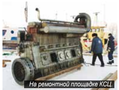
На ремонтной площадке КСЦ.