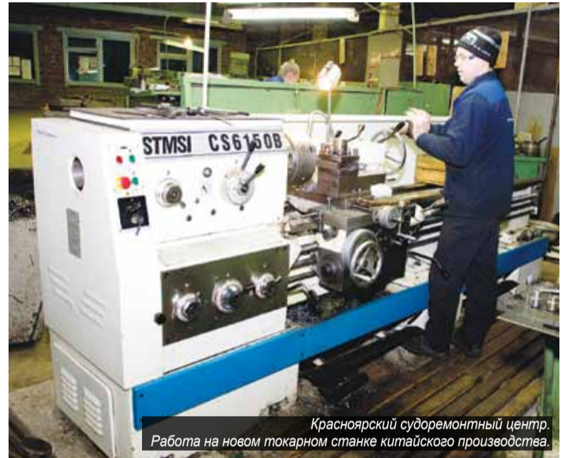
Красноярский судоремонтный центр. Работа на новом токарном станке китайского производства.

Со дня на день начнется ремонт гребных валов на новом токарном