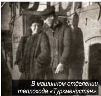
В машинном отделении теплохода «Туркменистан».