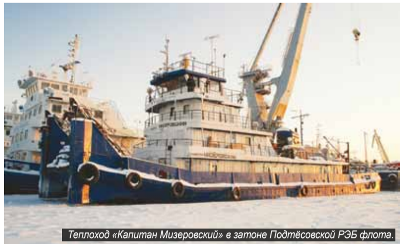
Теплоход «Капитан Мизеровский» в затоне Подтёсовской РЭБ флота.

Сергей ИВАНОВ Фото из архива Музея истории и развития судоходства в Енисейском бассейне