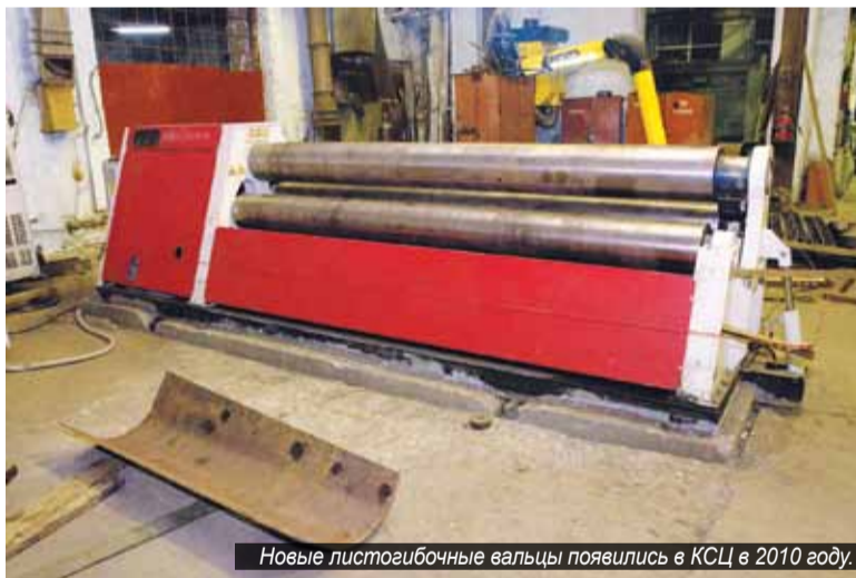
Новые листогибочные вальцы появились в КСЦ в 2010 году.

Правда, такое удовольствие дорогого стоит. К примеру, только листогибочный станок с компьютерным обеспечением обошёлся пароходству не в один миллион рублей. Зато теперь на нём готовятся компоненты судового набора с такой точностью, что ракетостроители позавидуют. Достаточно лишь ввести данные, которые необходимы, а всё остальное за человека делает машина. Кроме того, станок позволяет изготавливать детали длиной до 6 метров. Ранее, когда это было невозможно сделать на старом станке, приходилось сваривать составляющие судна из несколь-